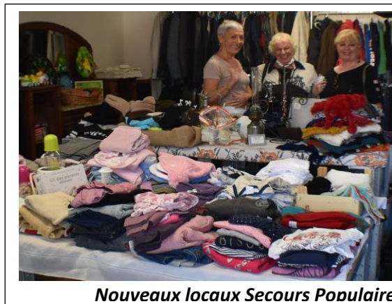
Nouveaux locaux Secours Populaire