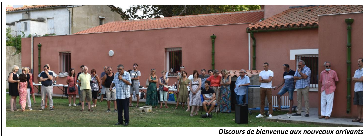
Discours de bienvenue aux nouveaux arrivants