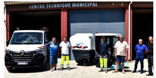
Nouveaux véhicules - services techniques

❖ Pose de l'éclairage LEDS sur le clocher de l'Église.