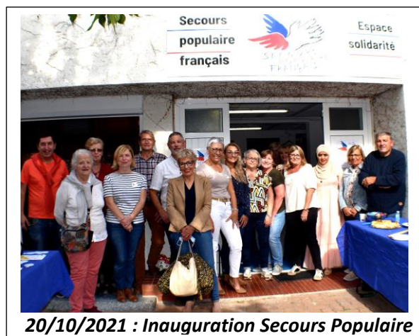
20/10/2021 : Inauguration Secours Populaire

Depuis le début de la crise sanitaire, le secteur associatif est mis à rude épreuve. Lors du confinement, deux tiers des associations ont dû suspendre leurs activités habituelles. Pour autant, les acteurs du secteur ne baissent pas les bras. Rencontre avec des hommes et des femmes qui redoublent d'efforts, de créativité et de détermination pour poursuivre leurs engagements au service des autres.