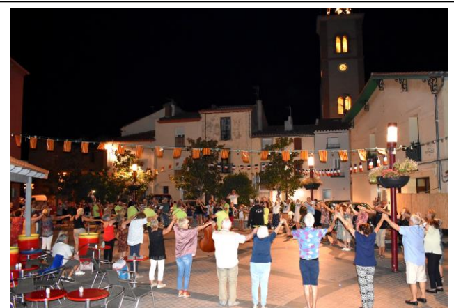
Balades de sardanes – Pl. de la République