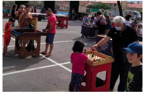
14 Juillet: Jeux en bois