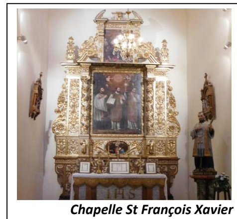
Chapelle St François Xavier