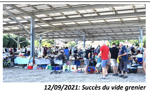
12/09/2021: Succès du vide grenier