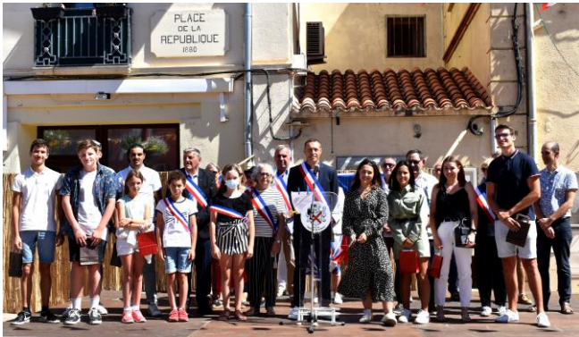
Remise de récompense aux jeunes diplômés

La Covid-19 est venue à nouveau perturber l'ensemble de la vie sociale et n'a pas épargné l'été, temps traditionnellement dévolu aux fêtes et à la liesse. Pour autant, tout a été mis en œuvre dans le respect des contraintes sanitaires pour maintenir l'esprit de convivialité et de partage durant la période estivale.