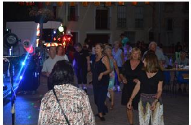
Week-end St Félicien