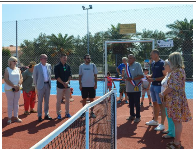
10/07/2021: Inauguration des courts de tennis