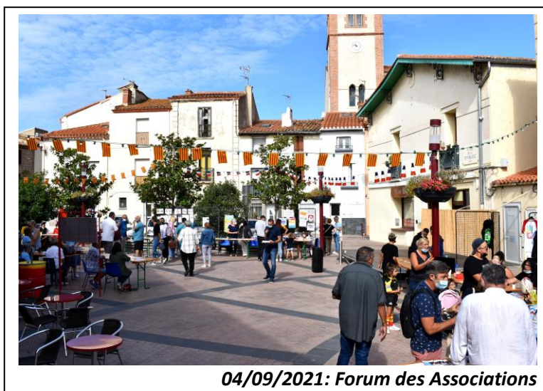
04/09/2021: Forum des Associations