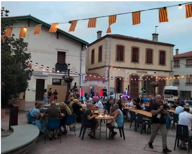
Week-end St Félicien