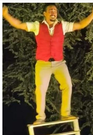
14 juillet : cirque

Des moments conviviaux qui ont pu se dérouler sans heurt grâce à la surveillance du village par les ASVP de 19h30 à 23h30, du 5 juillet au 31 août.