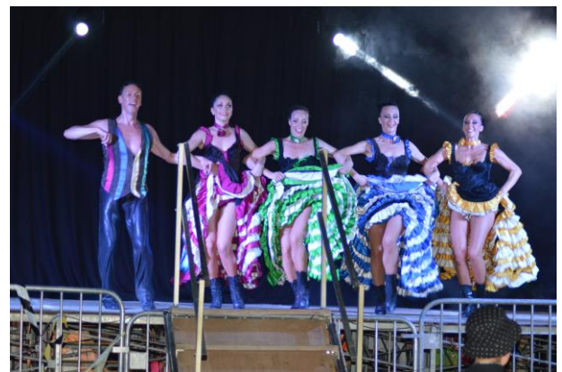
Fête locale : La Revue "Diam's"