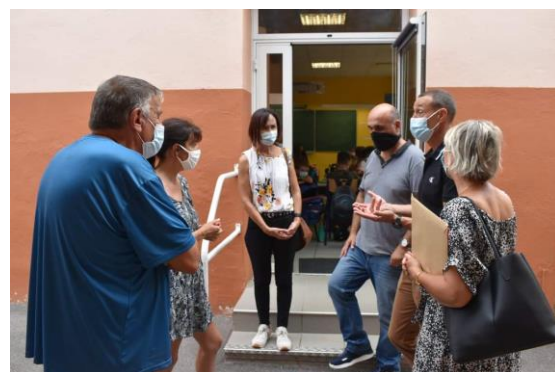
Visite de la nouvelle Inspectrice Académique