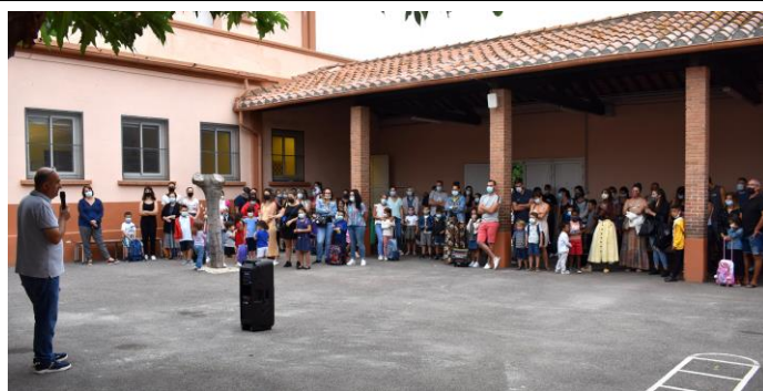
Rentrée à l'école élémentaire